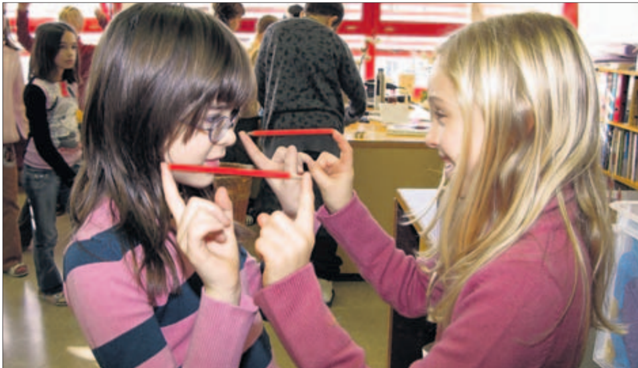
Ein Konzentrationsspiel nach dem «Pferderennen» hilft, am Ende der Bewegungspause wieder ruhig zu werden. (erb)

Schwerpunkte der Bewegungswoche sind ein gesunder Znüni, Pausenanima-