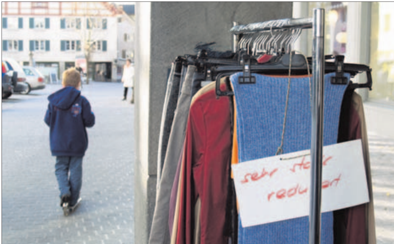
In Bülach gibt es kaum ein Geschäft, das in diesen Tagen nicht mit Preisnachlässen lockt. (scr)

Jeweils am Mittwoch, 23. und 30. Januar, informiert der Fernsehjournalist Thomas Stalder in einem Vortrag an der Volkshochschule darüber, wie die Sendung «Tagesschau» produziert wird. Die Vorträge beginnen um 19.30 Uhr und finden in den Räumen der Kantonsschule Bülach statt. Am 6. Februar findet um 18 Uhr zudem eine Führung durch das Schweizer Fernsehen statt. (ZU/NBT)